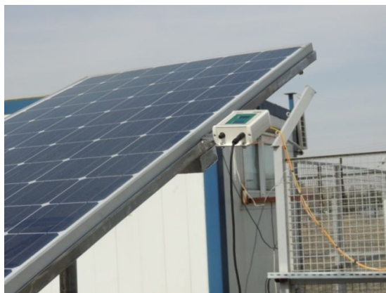
شکل 1. تصویری از یکی از پنل های نصب شده برای انجام تست های میدانی و سلول مرجع (در سمت راست پنل) برای اندازه گیری تابش خورشید

در هر ماه هرکدام از پنل ها روی شیب های محاسباتی سالیانه، فصلی و ماهیانه قرار گرفت و تابش رسیده به پنل ها به کمک سلول مرجع 1 ، نصب شده در کنار پنل ثبت گردید. هر سه پنل رو به جنوب نصب شدند. داده برداری ها از ساعت 9 الی 14 با فاصله زمانی یک ساعت انجام می شد و در پایان با میانگین گیری داده ها، تابش به دست آمده توسط هر سه پنل در طول ساعات داده برداری با هم مقایسه شد که برخی از این داده ها در قسمت نتایج ذکر شده اند.